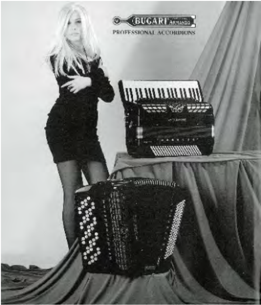
Reklam för Bugaridragospel, tillverkade i italienska Castelfidaro, dragspelsvärdens Mecka.