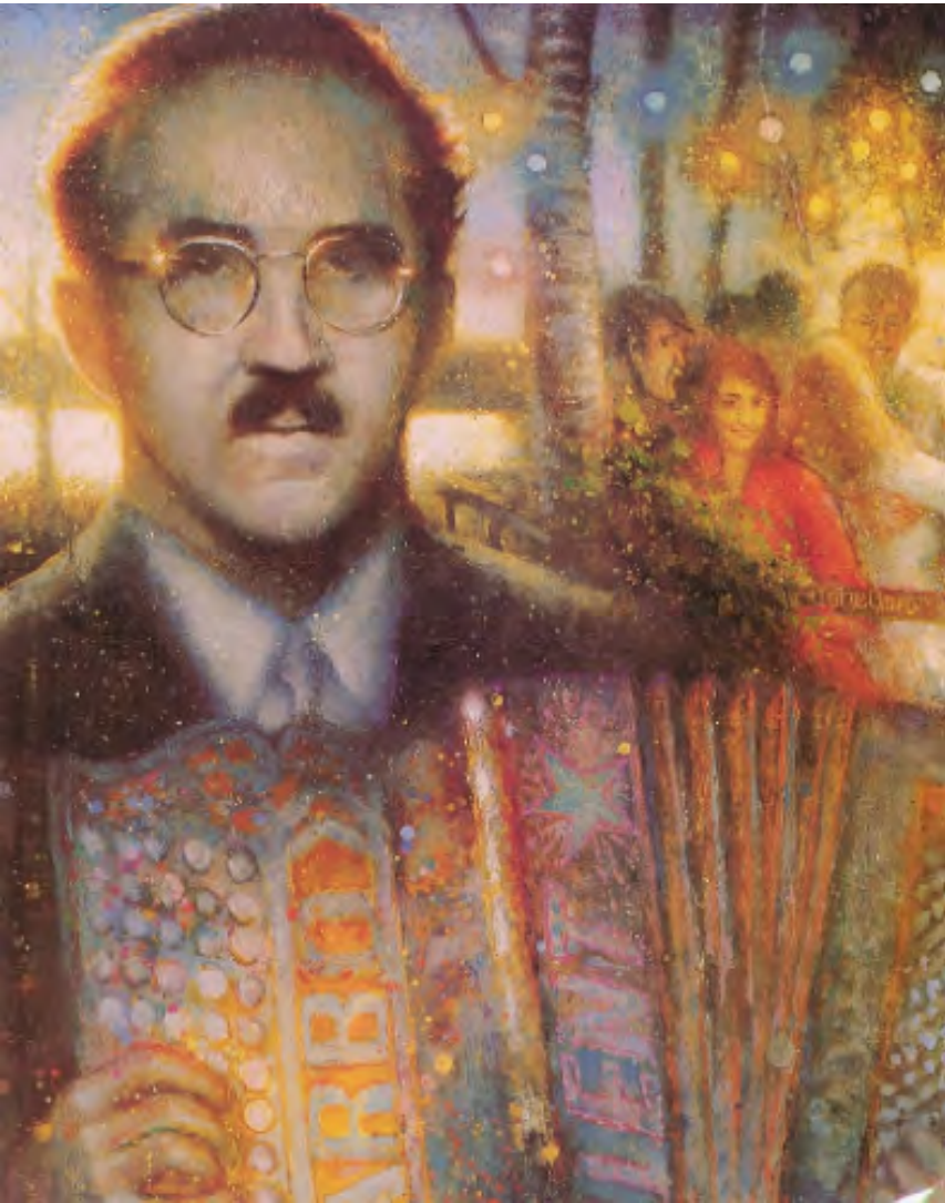
Carl Jularbo hör till Sveriges genom tiderna mest kända och mest inspelade artister. Han gjorde 1.576 inspelningar under sin nästan femtioåriga karriär.