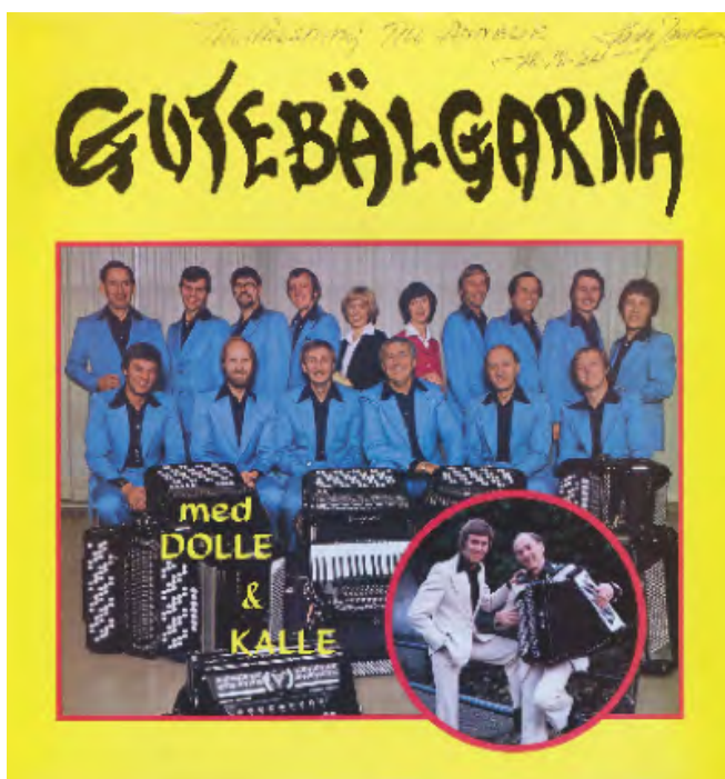
Skivomslag – Gutebälgarna.

Ingen vet förstås med säkerhet, men en närmare titt på dragspelsvärldens geografi ger visst stöd för dessa tankar. Det är i små orter som Ransäter, Älvdalen, Fjärås, Jularbo, Floda, Alfta, Hallstahammar och Stöde vi hittar dragspelsfirmorna, dragspelsstämmorna, skivbolagen, tidningsutgivarna och en hel del av klubbarna. Många av dessa orter ligger i norra Svealand och södra Norrland. Därav kan man dra slutsatsen att gammaldans och dragspel har sin starkaste förankring ”på landet”, som man säger i storstäderna. Men det finns tecken som tyder på att dragspelen också är starkt förankrade i medelstora städer och de större städernas utkanter.